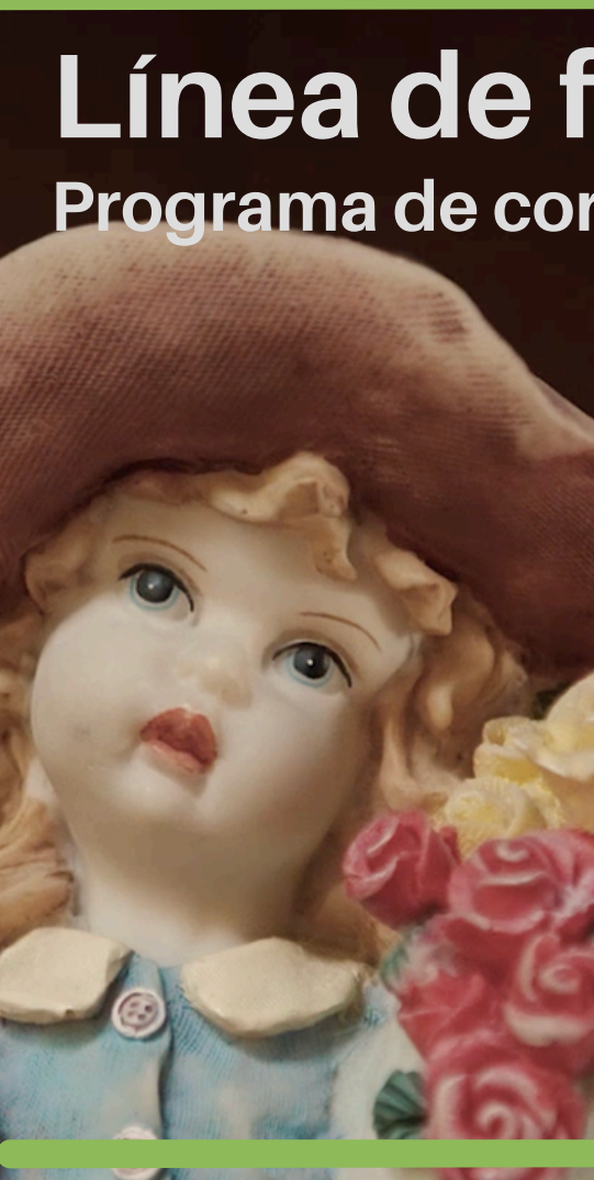
Tras las grietas Dir.: Nahuel Duran y Claudia Risco