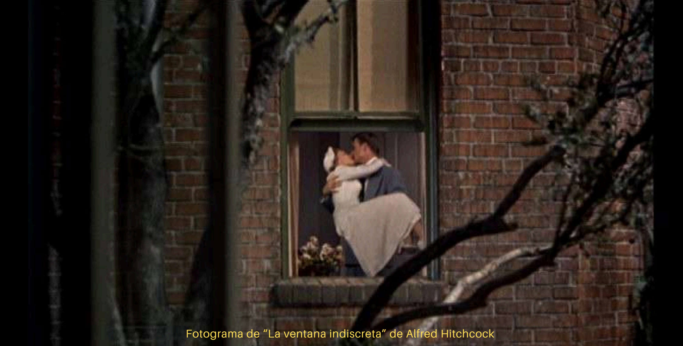
Fotograma de "La ventana indiscreta" de Alfred Hitchcock

En cada una de las fotos procuramos que haya al menos una persona, luego imaginamos y escribimos una pequeña historia inventada a partir de la imagen generada.